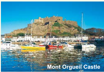
Mont Orgueil Castle