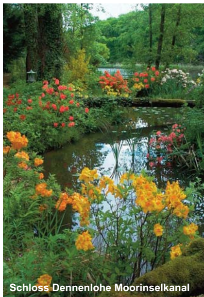
Schloss Dennenlohe Moorinselkanal