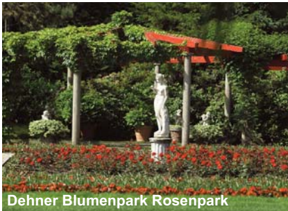
Dehner Blumenpark Rosenpark

Entdecken Sie die vielfältige bayerische Gartenkultur mit allen Sinnen. In Rain am Lech - nahe des Dehner Blumenparks mit meisterlich angelegten Schau- und Themengärten auf 30.000 m 2 liegt das 4-Sterne Dehner Blumen Hotel, Ihr Domizil während der Reise.