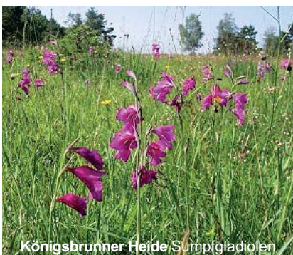
Königsbrunner Heide Sumpfgladiolen

Gegen Mittag endet diese letzte Führung am Blumen Hotel. Ihre Koffer stehen bereit, nun heißt es Abschied nehmen. Viele Informationen haben Sie erhalten und neue Eindrücke gewonnen. Vielleicht können Sie auch einige Tipps und Ideen zur Gestaltung des eigenen Gartenreichs mit nach Hause nehmen.