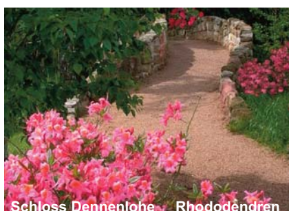
Schloss Dennenlohe Rhododendren