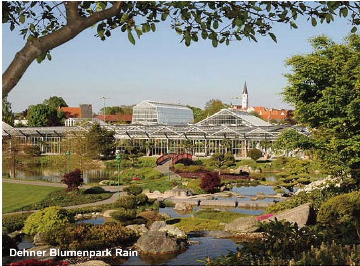
Dehner Blumenpark Rain

12.04. - 15.04.12 31.05. - 03.06.12 28.06. - 01.07.12 05.07. - 08.07.12