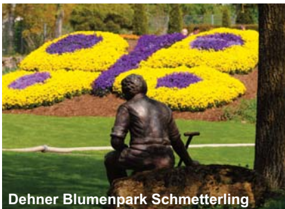
Dehner Blumenpark Schmetterling