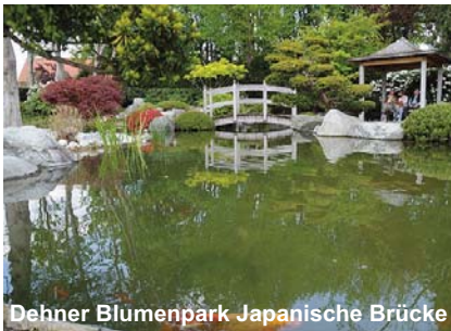
Dehner Blumenpark Japanische Brücke

Schon am Anreisetag besuchen Sie den herrlichen Dehner Blumenpark, weitere erlebnisreiche Ausflüge mit Besuchen fantastischer Gärten liegen in den Folgetagen vor Ihnen. Im Schloss Dennenlohe werden Sie von Baron von Süßkind erwartet. Mit Charme und großem Wissen führt Sie der Baron durch seinen außergewöhnlichen Privatgarten innerhalb der Schlossmauern. Ein weiteres Highlight ist der außergewöhnliche Garten von Barbara Krasmann, vielen von Ihnen bekannt aus der TV-Sendung 'Querbeet' im Bayerischen Fernsehen. Engagiert zeigt Sie Ihnen persönlich ihren herrlichen Privatgarten.