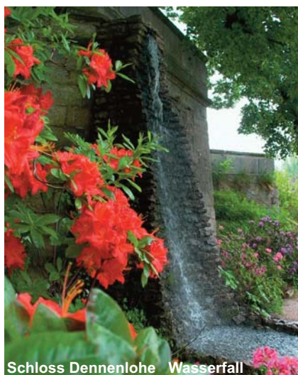
Schloss Dennenlohe Wasserfall