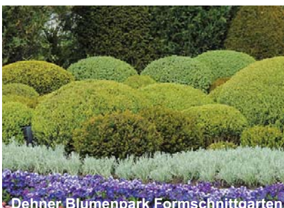
Dehner Blumenpark Formschnittgärten

Wie ein botanischer Garten präsentieren sich auf 30.000 qm 2 die Schaugärten des Dehner Blumenparks. Die Gartenanlage vereint Gartenelemente aus Asien, dem Mittelmeerraum und England in einem einzigartigen Ensemble. Eine der Hauptattraktionen ist der japanische Landschaftsgarten mit Großbonsais, Teichen, Wassertreppen, Findlingen und Bogenbrücke. Fast 2.000m 2 Wechselblumenbeete werden drei Mal im Jahr mit aktuellen Sorten bepflanzt und bieten so dem Besucher immer neue Anregungen für den eigenen Garten. Besonders im Mai ist der blühende Rhododendrenhain ein weiterer sehenswerter Höhepunkt. Neben Stein- und Rosengärten sind zudem zahlreiche Trockenmauern aus Schiefer und Sandstein angelegt, die auf den Kronen und in den Fugen mit Stauden bepflanzt sind. Angegliedert an die Schauanlagen gibt es seit 2009 einen 1,2 ha großen Naturlehrgarten mit heimischen Baum- und Straucharten sowie einer 450 m 2 großen Biotoplanlage mit Sumpf- und Wasserpflanzen. 120 Tiere, in Bronze gegossen, können in Ihrem natürlichen Umfeld bestaunt werden.