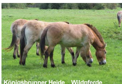
Königsbrunner Heide Wildpferde