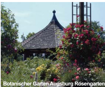
Botanischer Garten Augsburg Rosengarten

Ein abwechslungsreicher Tag geht zu Ende. Ihr Bus bringt Sie zurück zum Blumen Hotel in Rain. Das Abendessen wird Ihnen serviert.