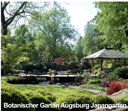
Botanischer Garten Augsburg Japangarten

Am Nachmittag steht ein vielfältiger Naturraum und zugleich ein botanisches Schmuckstück auf dem Programm: der Botanische Garten, der sich auf ca. 10 ha am Rande des Siebentischwalds, eines stadtnahen Naherholungsgebiets erstreckt. Im Rahmen eines Rundgangs werden einige der Garten-Höhepunkte wie z.B. der Apothekergarten, die "Pflanzenwelt unter Glas", der Senkgarten und der Japanische Garten näher vorgestellt. Sie erfahren Wissenswertes und Unterhaltendes aus dem grünen Reich der Botanik.